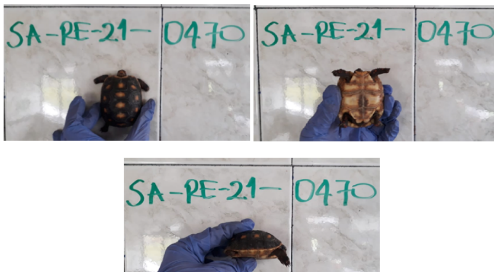
Fotos 2 -4. Individuo vivo de Chelonoidis carbonarius - tortuga morrocoy No. de rótulo SA-RE-21-0470. Acta Única de Control al tráfico ilegal de flora y fauna silvestre No. 161243.